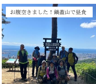
お腹空きました！鍋蓋山で昼食