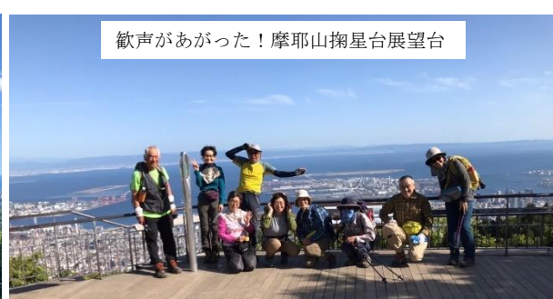
歓声があがった！摩耶山掬星台展望台